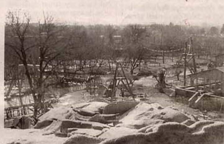
Une vue générale de la structure avec le parc forestier d'un côté, le parc aquatique de l'autre.