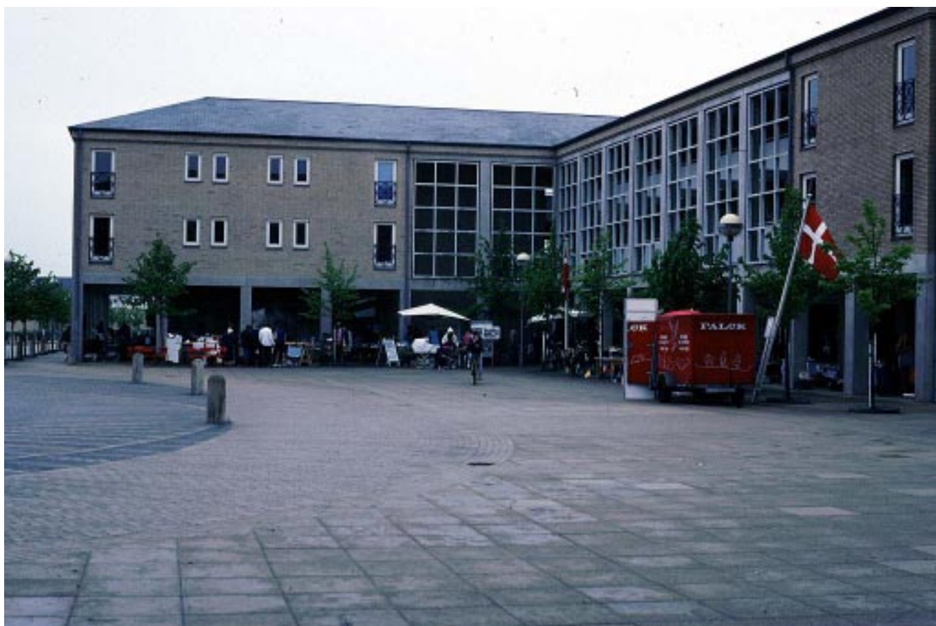
Høje Tåstrup. Stationstorget (syd) ovan - inte ens vid festival på torget lyckas det att fylla det med aktivitet. Bänken nedan vid Netto är senare borttagen på grund av A-laget och Netto affären är nedlagd 2002, därför att omsättningen var för liten. Kontors-kvarteren har få dörrar och väl högt placerade fönster. Några dörrar hänvisar till entréer annanstans.