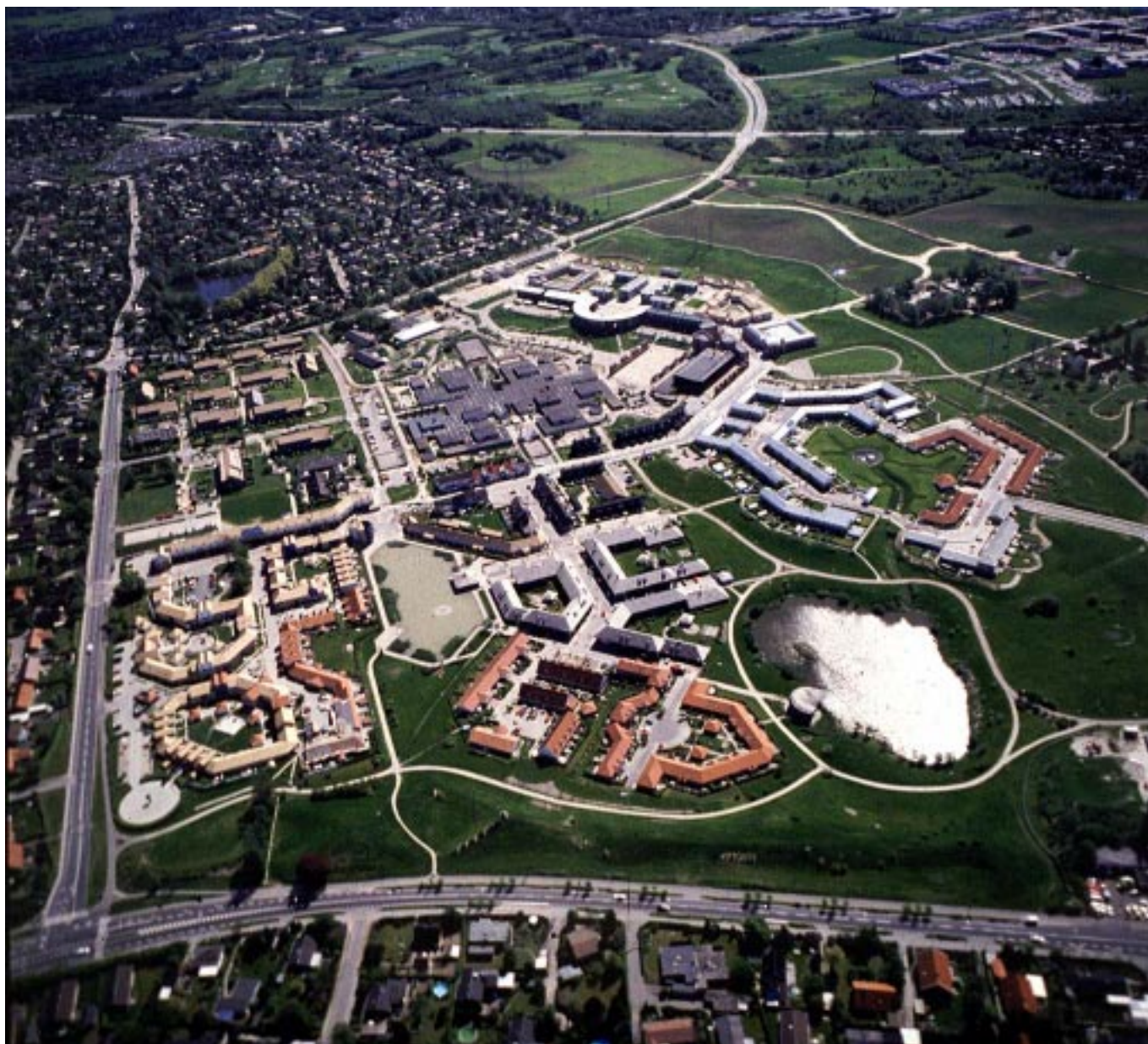
Egebjerggård med butiksarkad längs huvudgatan (Egebjerg Bygade)