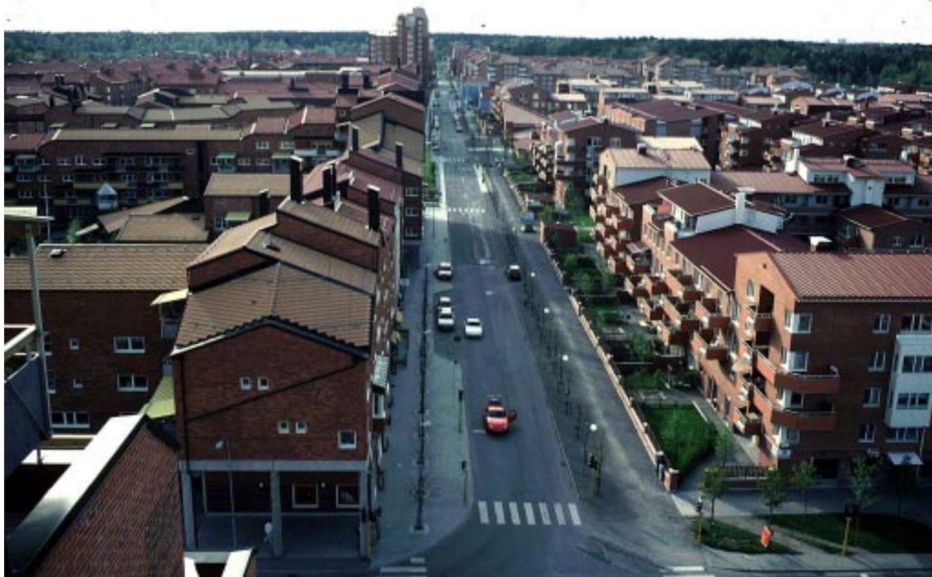
Skarpnäck med huvudgatan Allén. Bilden ovan är tagen en vanlig dag när området var nytt och träden små. Bostäder på solsidan, affärer på skuggsidan. Inte ens när det är festival (nedan till vänster) kan allén fyllas med folk och aktiviteter mera än på en del. Kvartersstaden idé med att blanda boende och arbete är svår i praktiken. Det blev aldrig så många affärslokaler på gathörnen som tilltänkt i planen, och av de som kom fungerar flera dåligt därför att läget inte är bra nog.