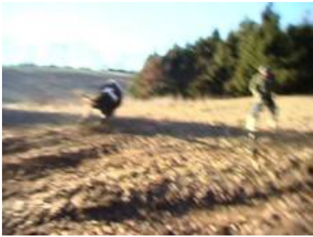
Er rennt um sein Leben!