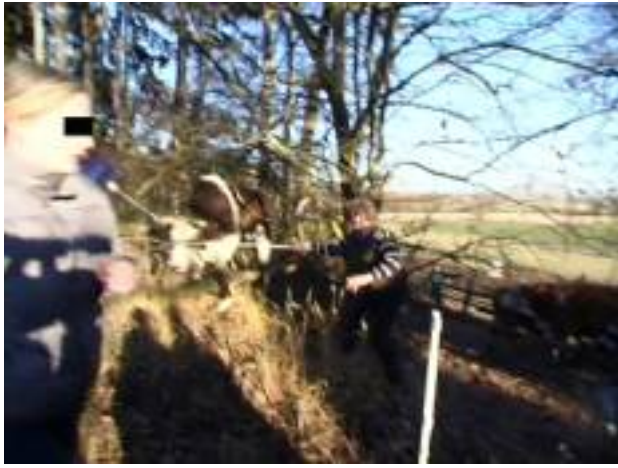
Er durchbricht die Absperrung!