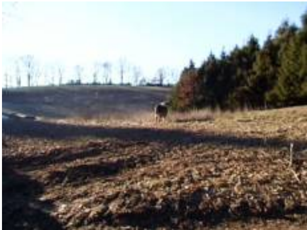
Und Happy flüchtet in den Wald!